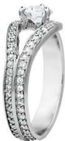
АРТИКУЛ: 05900037-6 ВЕС: 3,82 гр.