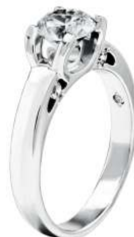
АРТИКУЛ: 05900046-6 ВЕС: 3,77 гр.