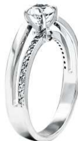
АРТИКУЛ: 05900024-6 ВЕС: 3,72 гр.