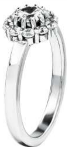
АРТИКУЛ: 05900001-6 ВЕС: 3,20 гр.