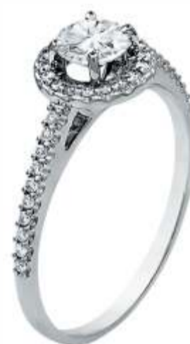
АРТИКУЛ: 05980028-6 ВЕС: 3,32 гр.