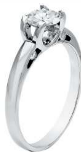
АРТИКУЛ: 05900029-6 ВЕС: 2,77 гр.