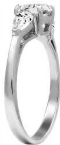
АРТИКУЛ: 05900012-6 ВЕС: 2,47 гр.