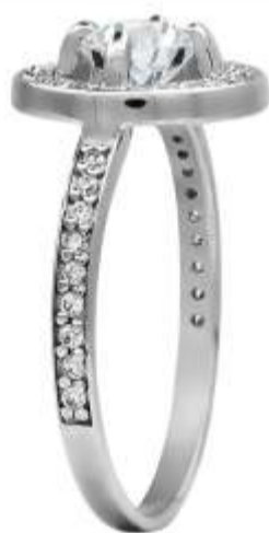
АРТИКУЛ: 05900004-6 ВЕС: 2,47 гр.