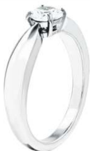
АРТИКУЛ: 05900007-6 ВЕС: 4,10 гр.