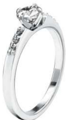
АРТИКУЛ: 05900027-6 ВЕС: 2,64 гр.