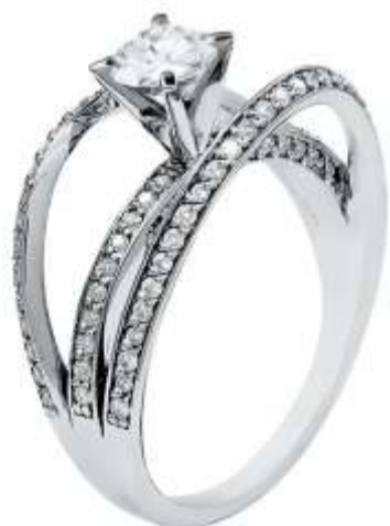
АРТИКУЛ: 05900020-6 ВЕС: 4,52 гр.